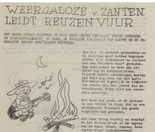
Oûbaas Roel van Zanten vertelt het tijgerverhaal tijdens het Jupika 1962, zondag 10 juni 1962.